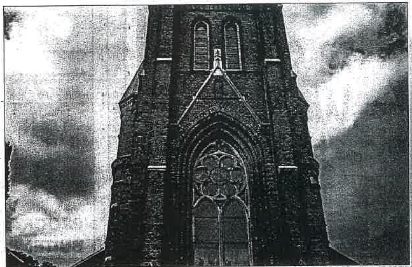
Toekomst kerk steeds duidelijker.