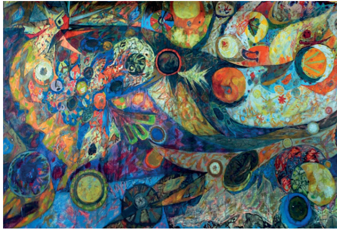
Johan van Reede, muurschildering Pauw met zonnestaart, detail, 1961. Deze is gered, maar een nieuwe locatie wordt nog gezocht.