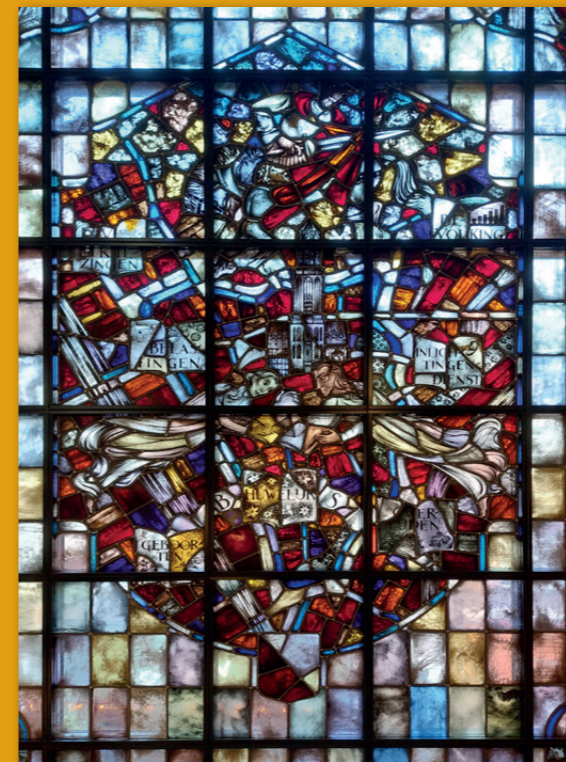
Bij de renovatie van het Utrechtse stadhuis in de jaren '90 werd het raam van Dick Broos uit 1940 uitgenomen. Op verzoek van de WMK is het raam in 2019 herplaatst op de oorspronkelijke locatie.

Voorzitter erfgoedvereniging Bond Heemschut