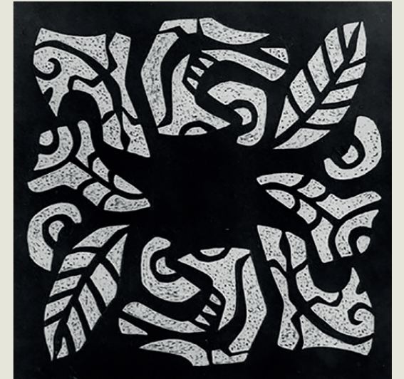
Jan Boon ontwierp in 1955 het Herderplein in Utrecht. In zwart-wit asfalt zijn geabstraheerde vogels, hagedissen, bloemen en bladvormen weergegeven. Het plein verkeerde in een zeer slechte staat en werd in 2022 ingrijpend gerestaureerd. De foto laat de onthulling in mei 2022 zien.

De abstract-geometrische kunststroming is, kort geformuleerd, een verdere doorontwikkeling van De Stijl. Cirkel, vierkant en rechthoek domineren de vormtaal. De beeldtaal is volledig abstract en het kleurgebruik beperkt zich meestal tot grijs tinten, wit en zwart of primaire kleuren. Ook deze kunstwerken zijn monumentaal en architectuurgebonden. Daarnaast zijn er vrijstaande kunstwerken en behoren sommige abstract-geometrische werken tot de zogenaamde land art .