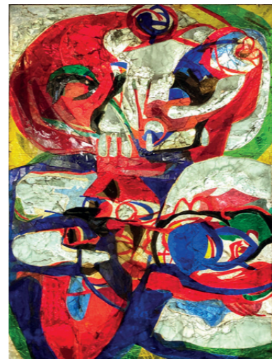
Joop van den Broek vervaardigde dit glas-appliquéaam zonder titel in 1965 voor het kantoor van het Gerling Konzern in Keulen. Het raam werd in 2020 in het Muziekcentrum van de Omroep in Hilversum herplaatst.