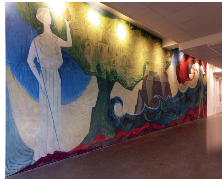
In 2021 werd deze in de aula van Stad & Esch in Meppel herplaatst.