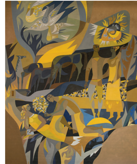
In 1961 bracht Marius de Leeuw in de wachtkamer voor de trouwzaal in het stadhuis in Rijen de muurschildering De liefde aan. Het werk was beschadigd en werd in september 2019 gerestaureerd en aangelicht.