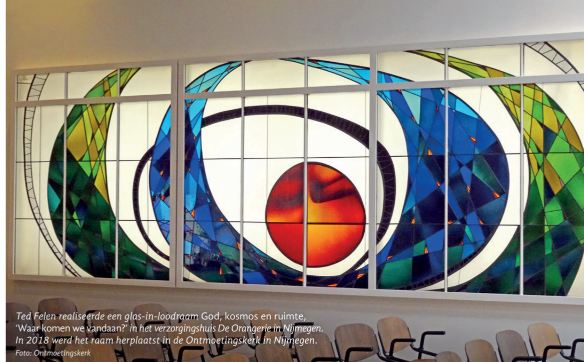
Ted Felen realiseerde een glas-in-loodraam God, kosmos en ruimte, 'Waar komen we vandaan?' in het verzorgingshuis De Orangerie in Nijmegen. In 2018 werd het raam herplaatst in de Ontmoetingskerk in Nijmegen.

Sinds enkele decennia wordt monumentale architectuurgebonden kunst ernstig bedreigd met sloop of ingrijpende revitalisering van gebouwen uit de wederopbouw. Vele kunstwerken zijn hierdoor al verloren gegaan. Dat geldt ook voor vrijstaande beelden. De WMK werd in 2014 opgericht om structureel het belang van deze kunst onder de aandacht te brengen.