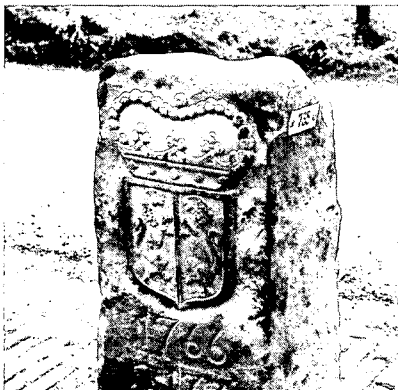
Close-up van de Dinxperlose steen met wapen van Gelre uit 1766.

Alle andere nog aanwezige achttiende-eeuwse stenen dragen als jaartal 1766. Toen werd in het klooster Gross Burlo bij Oeding (achter Winterswijk ) een verdrag gesloten