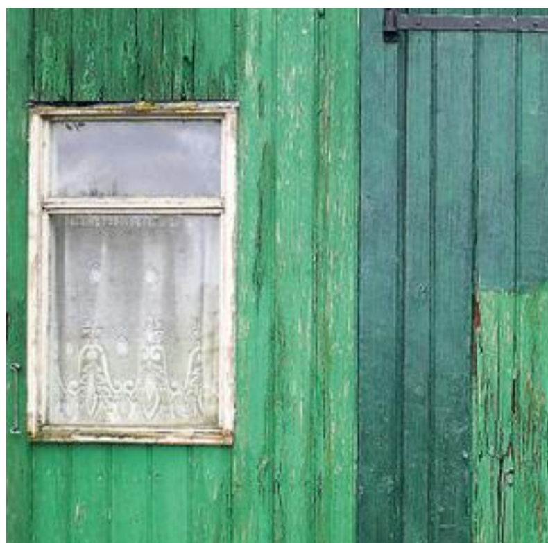
„Soms zie je aan de buitenkant niet hoe oud een bouwwerk kan zijn.”

Een aantal stolpboerderijen dat vanwege de sloop onder de loep is genomen, heeft verrassende resultaten opgeleverd. Zo was van de buitenkant niet goed te zien dat de stolp op de hoek van het Ganker en de Dorpsstraat in Nibbixwoud vermoedelijk rond 1675 al was neergezet. Nog een onverwacht 'oudje': een stolp die aan de Kerkbuurt in Berkhout verdween, bleek te zijn gebouwd rond 1643. Aan de Dorpsstraat in Zwaag stond een stolp die bij nader inzien rond 1647 is gebouwd. De oudste? Die stond aan de Streekweg op de grens van Hoogkarspel met Westwoud. Het hout uit het vierkant voor deze stolp kon worden teruggebracht tot 1560.