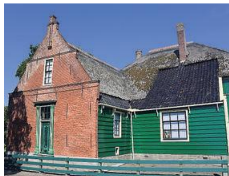
Statige stolp in Twisk, zichtbaar oud.

bouwgiedenis, de echte historie. Omdat het alleen in West-Friesland op deze schaal gebeurt, zijn we begonnen aan een inhaalslag. Vaak hebben we maar beperkt de tijd om alles te onderzoeken, omdat de mensen ook weer verder willen met de nieuwbouw. Daarom is het vaak een race tegen de klok.”