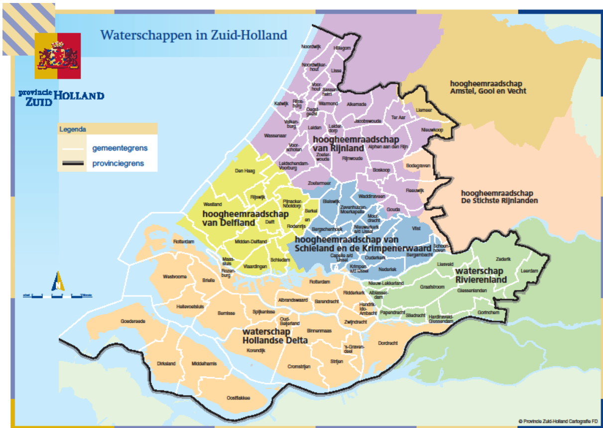
Kaart 1 Waterschappen in Zuid-Holland.