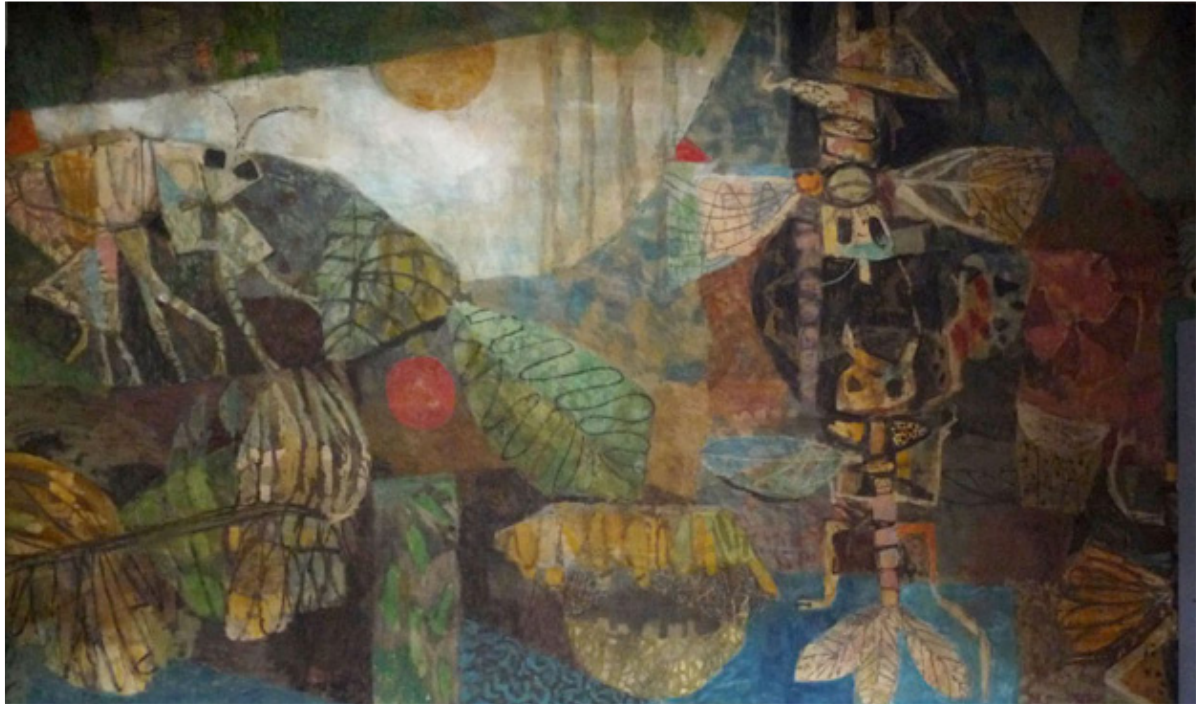
Muurschildering Kees Franse, Dijkzigtziekenhuis, 'Het leven der insecten', 1961, hoogte 377 x lengte 645 cm.

Nieuwsgierig geworden of popelt u een van de wandschilderingen te willen verwerven? Voor een volledig werkplan van de strappotechniek en een gespecificeerde begroting van de restaurator, kunt u contact opnemen met ondergetekende.